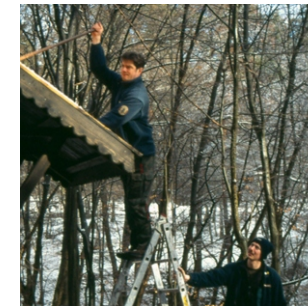
Die Ranger sind für die Instandhaltung von Besucherlenk- und Artenschutzeinrichtungen verantwortlich.