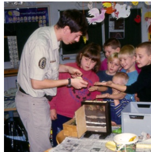
In den Schulen der Region sind die Ranger mit einem bunten Angebot zum Natur- und Umweltschutz unterwegs.

Ranger betreuen zwei Jugendeinrichtungen, die Wagenburg Groß Drewitz und die Jugendherberge Bremsdorfer Mühle. Dafür haben sie eine Waldralley und speziell zugeschnittene Führungen entwickelt.