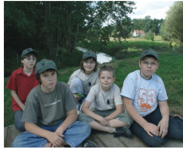
Eine unternehmungslustige Truppe - die Junior-Ranger!

Ranger betreuen zwei Jugendeinrichtungen, die Wagenburg Groß Drewitz und die Jugendherberge Bremsdorfer Mühle. Dafür haben sie eine Waldralley und speziell zugeschnittene Führungen entwickelt.